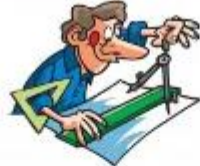
der Architekt, -en die Architektin, -nen