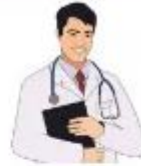
der Arzt, -e die Ärztin, -nen