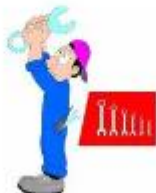
der Handwerker, -- die Handwerkerin, -nen