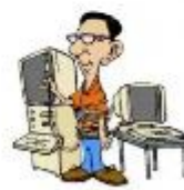
der Informatiker, -- die Informatikerin, -nen