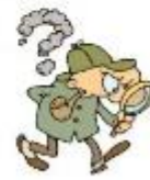
der Detektiv, -e die Detektivin, -nen