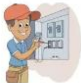
der Elektriker, -- die Elektrikerin, -nen