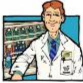
der Apotheker, -- die Apothekerin, -nen

Schau die Bilder an und zeichne andere Berufe.