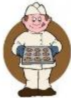
der Bäcker, -- die Bäckerin, -nen