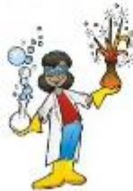
der Chemiker, -- die Chemikerin, -nen