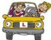
der Fahrlehrer, -- die Fahrlehrerin, -nen