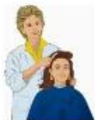
der Frisör, -e die Frisörin, -nen