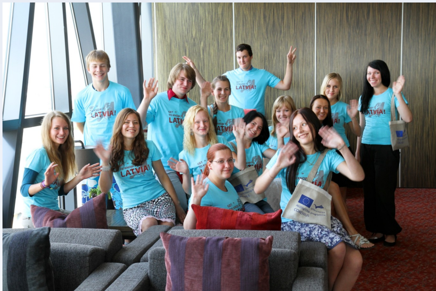
Latvijas jaunieši pirms došanās uz Eiropas skolām.

2010./2011. mācību gadā Latvijā mācīsies arī ārvalstu jaunieši. Šomēnes mācības Līvānu 1. vidusskolā uzsākuši divi somu jaunieši. Viņi ir pirmie ārvalstu skolēni, kas ieradušies Latvijā jaunās Comenius skolēnu individuālās mobilitātes ietvaros. Savukārt otrajā semestrī divi jaunieši no Francijas kopā ar latviešu skolēniem apgūs mācības Rīgas Centra hu-