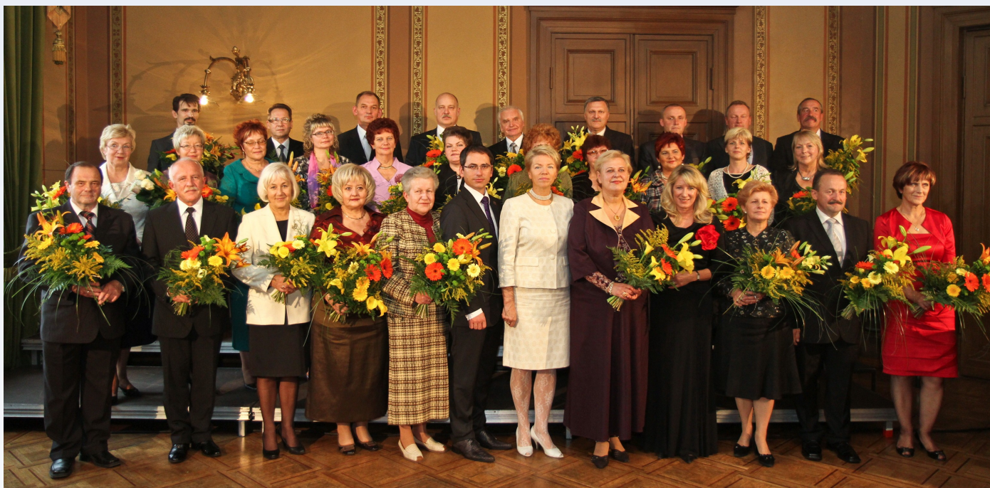
Izglītības un zinātnes ministre Tatjana Kože un IZM valsts sekretārs Mareks Gruskenics (centrā) ar apbalvotajiem izglītības un zinātnes darbiniekiem Latvijas Nacionālās operas Beletažas zālē 2010.gada 25.septembrī.

Sestdien, 25.septembrī, nedēļu pirms Skolotāju dienas, izglītības un zinātnes ministre Tatjana Kože pasniedza Izglītības un zinātnes ministrijas (IZM) augstāko apbalvojumu – IZM balvu – 30 izcilām nozares darbiniekiem. Balvā bija īpašs šim notikumam veltīts rokas pulkstenis ar gravējumu „IZM balva – 2010” un ministres parakstīts goda diploms.