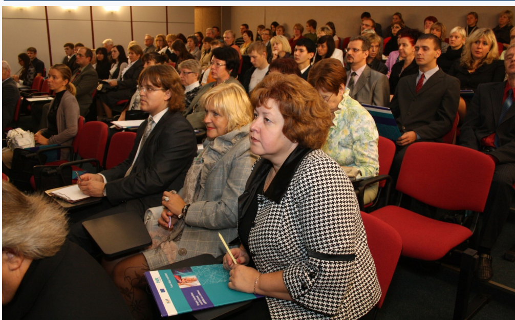
17.septembrī Rīgas Amatniecības vidusskolā notika Rīgas reģiona profesionālās izglītības foruma „Eiropas Savienības struktūrfondu atbalsts profesionālās izglītības modernizācijai”, kas noslēdza reģionālo forumu ciklu visā Latvijā.

Pagājušajā vasarā krīze piespieda uzsākt profesionālās izglītības tīkla reorganizāciju, ko patiesībā vajadzēja veikt jau sen. Pēdējā gada laikā padarīts ir ļoti daudz, taču tas ir tikai sākums visas sistēmas reformai, ko turpināsim darīt plānveidīgi un mērķtiecīgi - saskaņā ar Profesionālās izglītības iestāžu tīkla optimizācijas pamatnostādņiem 2010. - 2015.gadam un skolu izstrādātajām attīstības un investīciju stratēģijām. Esmu pārliecināts, ka lūzuma punkts ir sasniegts. Sociālie partneri, nozaru asociācijas