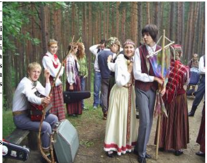
Folkloras kopa uzstājas Starptautiskajā folkloras festivālā „Pulkā eimu, pulkā teku”.

Protams, būtu jābūt kopā ar sev mīļajiem un tuvajiem cilvēkiem. No sirds vienam otram vajadzētu vēlēties laimi, veselību. Un noteikti jādomā labas domas, jo tām ir ļoti liels spēks, aiziet arī uz baznīcu. Protams, arī aiziet čigānos un kārtīgi izballēties, daudz ēst pupas un zirņus, lai nebūtu jāraud.